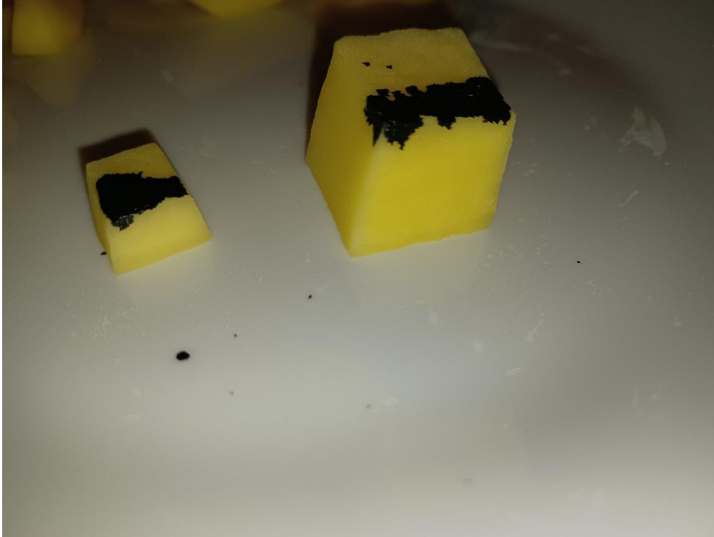
Slika 1.: Prikazuje prodiranje boje odnosno tuša u veću i manju kocku krumpira.

Zaključak: Rezultat se ne podudara sa mojim očekivanjima. Boja je bolje i više prošla kroz veću kocku. Više hranjivih tvari trebaju veće stanice, veći omjer površine i volumena ima veća kocka. Te je veća kockica primila više tvari. Stanice su male zato što im treba dovoljno velik površinu za izmjenu tvari s okolišem.